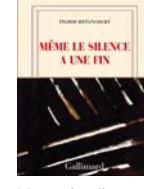
Même le silence à une fin Ingrid Betancourt