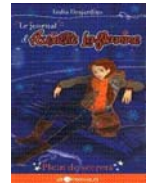
Le journal d'Aurélien Laflamme Tome 7 India Desjardins