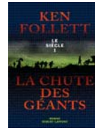
Le siècle 1 Ken Follet